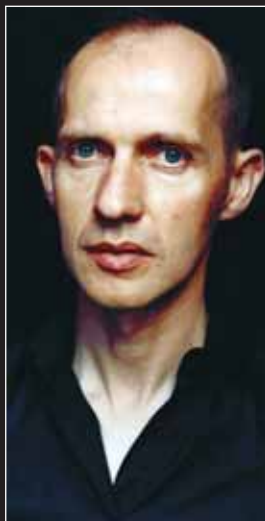
Iarla Ó Lionáird

Is é an toradh atá ar an obair go léir seo ná go bhfuil lámhleabhar/catalog á cur le chéile ag an Ionad Cultúrtha i láthair na huaire le comh-mhaoiniú ó Mheitheal Forbartha na Gaeltachta agus Comhairle Chontae Chorcaí.