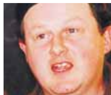
Cathal Ó Searcaigh

Eolas: www.samhainpoetry.com/Festival.htm