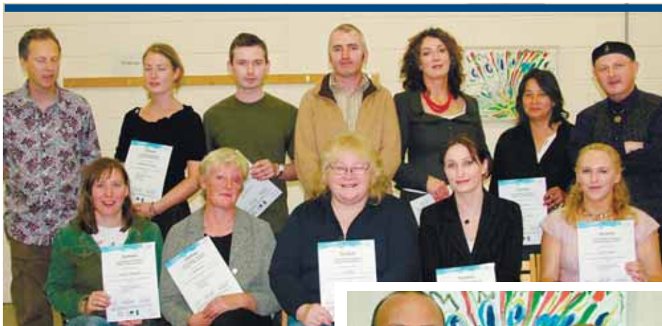
Bronadh teastas Tearmann