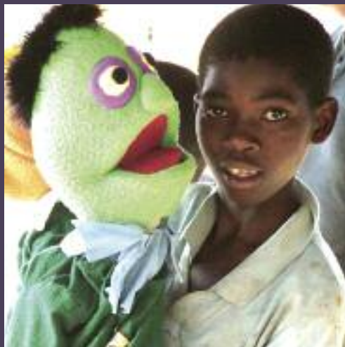
Fíbín Idirnáisiúnta: Thug Fíbín a seó 'An Rón Dall' go dtí an Mhaláiv i mbliana.

Tá an-éileamh ar stíl drámaíochta leithleach Fíbín